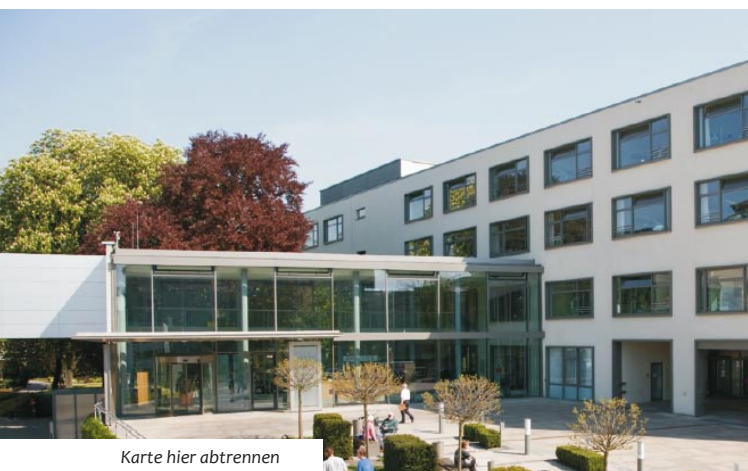
Karte hier abtrennen